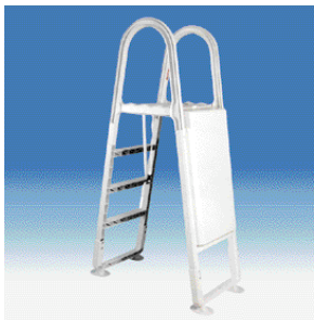
Echelle double avec sécurité enfant