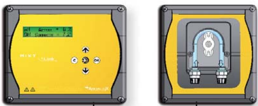
3ml câble monté