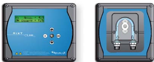
3ml câble monté