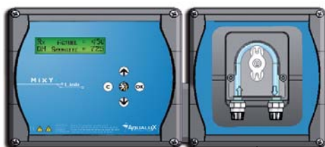
3ml câble monté