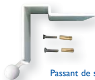
Passant de sangle