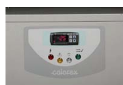
Panneau de contrôle Gamme 29 - 31